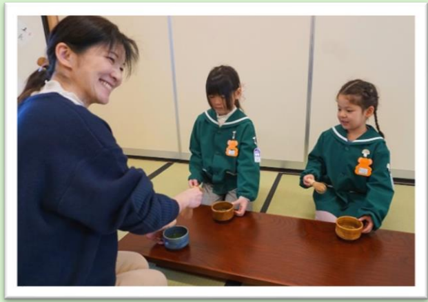
心を込めてお茶をたてました。溢さないようにお客さまの元へ運びます。