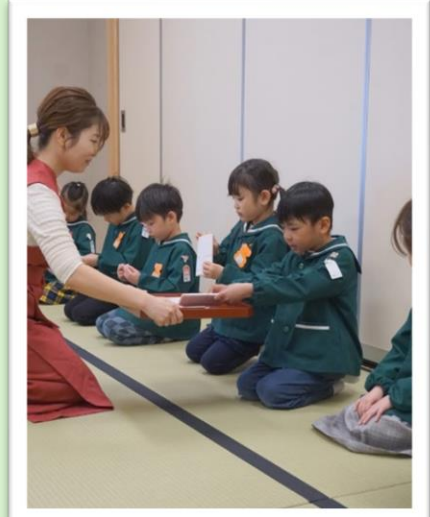
卒園の記念に懐紙をいただきました。最後はクラス全員で『2年間ありがとうございました。』のお礼をしました。