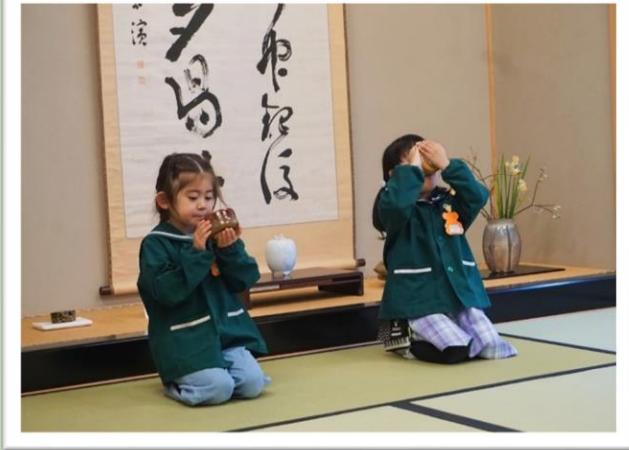
飲みきりの『ズツ』という音に続き、『おいしかったー！』という声も聞こえました。